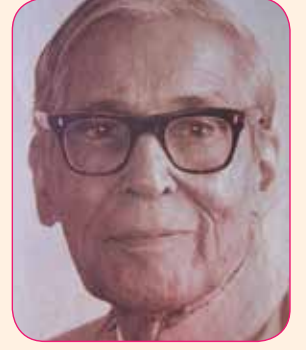
ಪ್ರೊ. ರಂ. ಶ್ರೀ. ಮುಗಳಿ

ಕನ್ನಡ ಸಾಹಿತ್ಯದ ಮೇರು ವ್ಯಕ್ತಿಗಳಲ್ಲಿ ಒಬ್ಬರಾದ ಡಾ: ರಂಗನಾಥ ಶ್ರೀನಿವಾಸ ಮುಗಳಿ ಅವರು ಕನ್ನಡ ಸಾಹಿತ್ಯ ಮತ್ತು ಸಂಶೋಧನಾ ಕ್ಷೇತ್ರಕ್ಕೆ ಅಪೂರ್ವ ಕೊಡುಗೆ ನೀಡಿದವರು.